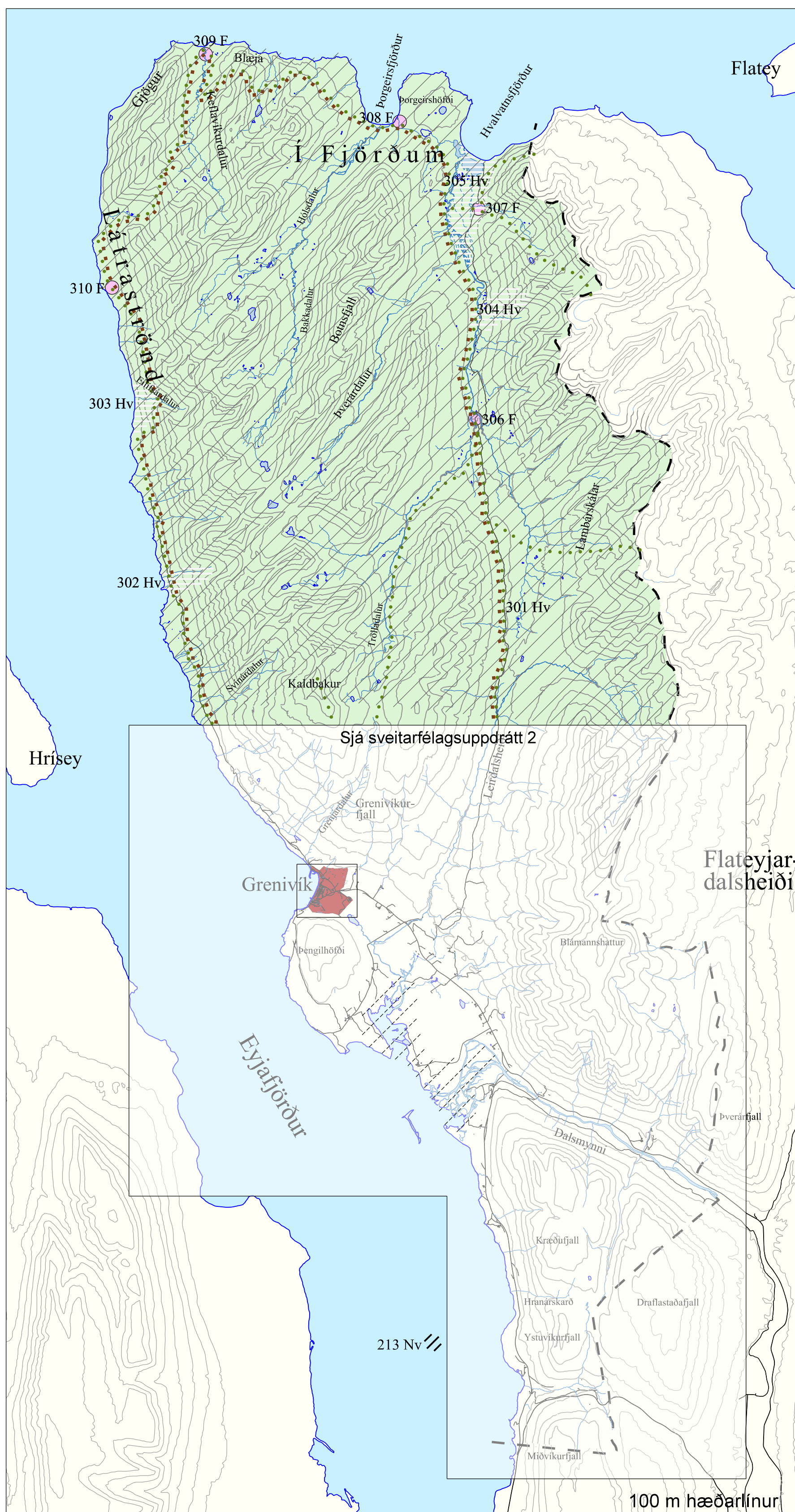
SVEITARFÉLAGSUPPDRÁTTUR 1 ÓBYGGÐIR 1:100.000